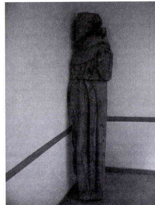
San Francisco de Asís (?) . Siglo XVII. Talla procedente de la capilla lateral homónima de la iglesia franciscana de San Guillén de Castielfabib. Casa Abadía de Casas Bajas.

la casa abadía de Casas Bajas 16 y que proceden de las capillas laterales del cenobio castielero: la Inmaculada Concepción y un santo franciscano, muy probablemente San Francisco de Asís. Aunque se encuentran en un lamentable estado de conservación, sería conveniente su restauración por el alto valor que encierran a nivel comarcal. La presencia de estas dos obras en Casas Bajas indica que el patrimonio sacro que quedaba en el cenobio castielero en 1835 fue distribuido, bien mediante donación bien mediante venta, por las vicarías de la comarca.